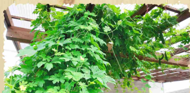
センター前の菜園にニガウリが実りました！